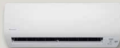
CTXS-K / FTXS-K